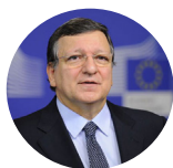
José Manuel Barroso Bývalý předseda Evropské komise

„Díky účasti na předchozích zasedáních EYP mohu potvrdit, že se jedná o opravdu jedinečný zážitek a velice obohacující zkušenost pro mladé lidi, kteří se chtějí dále rozvíjet.“